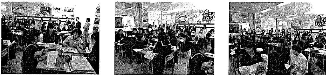
写真2 学習グループで話し合いをしたり、発表を聴いたりしている様子（公開研究会）

同じ教材に対しても、生徒によって様々な考え方や感じ方、とらえ方があり、それを共有する中で、異なる意見の受容や共有、思考の深化がなされ、それが自己の考え方をより深めたり、変容させたりと、興味深い時間となった。