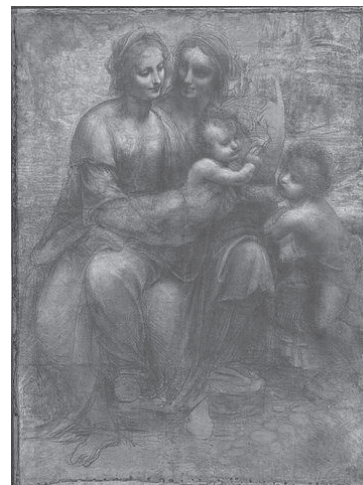
図4『聖アンナと聖母子と幼児聖ヨハネ』