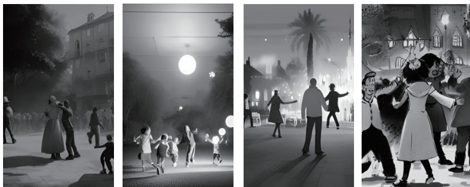
図 9 画像作成 AI に「夜の公園でダンスをする人たち」を描かせた作品

仮に美術の授業で「夜の公園でダンスをする人たち」を描きなさいという課題を与えた場合、生徒は AI にこのような絵を描かせ、課題で指定された画材に応じて、それを鉛筆や絵の具で画用紙などに描き写せば簡単に作品を完成させることができる。この場合、生徒に必要な技術は、「AI に指示をする言葉の入力」と「描き写す際に使用する鉛筆や絵の具を使いこなす技術」だけである。それでも手作業で描き写すという作業があれば、AI の画像を細部まで観察する力と描画の用具を使いこなす技術だけは身につくであろうと思われるが、この制作過程のどこが創造的なのかと問われれば、創造的なのは AI であると答えざるを得ない。