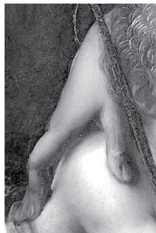
図8 ロンドン版 祝福