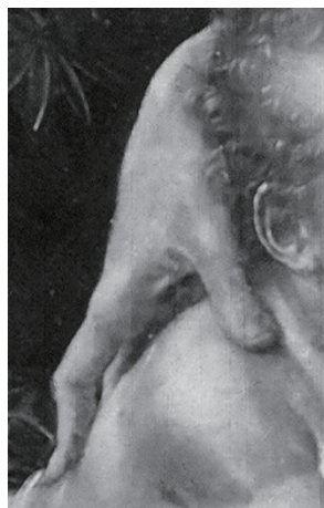
図7 ルーブル版 指差し

る、ルーブル版と異なる表現の部分は細部に至るまでレオナルドの指示に従って描かれたものであることを確信した。私は以前からルーブル版では合掌する幼児がイエスであるという少数派の説を支持し、ロンドン版では合掌する幼児がヨハネになっている点には違和感を感じていたが、それはレオナルド以外の誰かがロンドン版を描いた際に幼児の位置関係を誤った結果だと短絡していた。しかし上記のテーマ2とテーマ3から解った事は、ロンドン版では最初から合掌する幼児を意図的にヨハネとして描いており、幼児の年齢差も周辺の環境や象徴もそれに応じて相応しく描かれているということが確認でき、レオナルド自身が承知の上で描かれたものだと確信した。なぜ幼児の配置をルーブル版と逆にしたのかという理由は解らないが、クライアントの要求によるものか、レオナルドの教会批判の表現なのか、その他の事情なのかの答えとなる記録は見つかっておらず、妄想的な推測しかできない。ロンドン版には合掌する幼児の手の上下に文字入りのリボンが描かれているので、その文が解読できればヒントとなるのかも知れない。ルーブル版の合掌する幼児がイエスであるという説を支持する研究者がその根拠とする一つに「天使の指差し」がある。ルーブル版では天使が合掌する幼児を指差しているが、レオナルドの絵