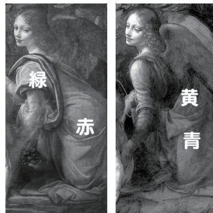
図5 天使のマントの色の比較

テーマ4は、最初は「構図の比較」として始めた研究であった。それは、岩窟の聖母に描かれた4人の頭部を四角形に線で結び構図を比較するという研究であったが、どちらも同じ下絵から書き写されており、頭部の位置を直線で結んで測定し位置関係を比較しても、有意義な結論につながると思えなかった。そのため「構図」を「画面上の色彩分布」と解釈して比較考察する様に勧めた。授業中は素直に変更を受け入れて「色彩配置の比較」へとテーマを修正したが、「構図=画面上の色彩分布」という関係が最後まで腑に落ちていなかった様である。天使の衣装の色の違いや聖母マリアの衣装の色の違いなど具体的な例も示したのだが、うまく理解させることができなかった。天使の