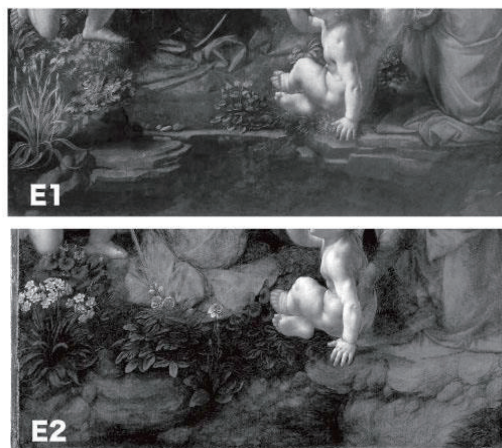
図3 前景の植物と地面

植物と地面の表現の比較では、図3のE1とE2を比較すると、前景の地面や植物の表現は全く異なる表現であり、それらは異なる意図や目的で描かれたと考えるべきであり、E1をE2に描き直したとは考えにくい。レオナルドの絵画制作プロセスでは板に絵の具で描く前に、紙に木炭やチョークで原寸大の下絵を描いており、その段階でテーマや構図は十分に検討され決定しているはずである。クライアントが下絵を確認した上で発注を受けて絵の具での制作を行なっているはずなので、下絵の段階で描かれていた部分に変更すべき点があれば、絵の具による制作に取り掛かる前に修正されたはずである。図4『聖アンナと聖母子と幼児聖ヨハネ』(ロンドンのナショナル・ギャラリー所蔵)を見ると、人物のポーズや表情は詳細に描かれ陰影もつけられているが、背景の山々や前景の川などは大まかな線描きだけである。『岩窟の聖母』にも同様の下絵が存在したはずであり、人物のポーズや岩窟の形状などルーブル版とロンドン版に共通する部分は、下絵のまま変更されずに描かれたものと考えられる。『岩窟の聖母』も下絵の段階では、前景の地面や植物は大まかにしか描かれていなかったと思われる。その段階でクライアントの承認を得てその後の制作を進めていたはずである。何らかの変更を迫られたとすれば、おそらく下絵段階で詳細に描かれており確認ができた部分の変更であったはずであり、それは人物のポーズや配置であった可能性が高いと考えられ、その点ではテーマ2の考察に繋がる。テーマ3の考察ではE1とE2の違いを前景の植物と地面の表現に限定して比較してみると、E1は手前からマリアの足元まで水面が続き、マリアの衣装の裾は水に浸かっているが、E2の方は、手前に乾いた荒地の岩が描かれていることがわかる。テーマ3では、前景の違いが何を意味するのかということ掘り下げる方向に指導した。テーマ2で考察した結果と同様に、この植物と地面の変更は、幼児イエスと幼児ヨハネの配置換えに起因する結果であると考えられる。象徴的な相互関係は辻褄が合う。つまりE1では、左端にキリストの誕生を祝う場面で登場するアイリスが描かれているので、その奥の岩の上に描かれているのが幼児イエスであることを暗示していると考えられる。水辺に座り